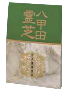
(株)東北産業 八甲田霊芝 (100g) 【⑳-003】 3,780円