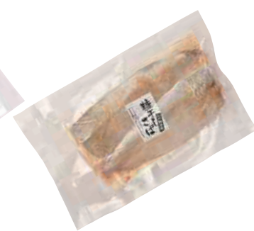
(同)マルカネ 糠干しさば (2枚入)【⑩-009】 420円