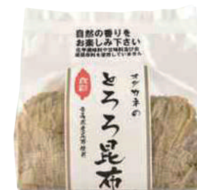
(株)オダカネ とろろ昆布 (72g) 【⑨-008】 760円