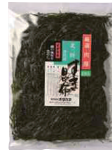
(株)オダカネ すき昆布 (2枚入) 【⑨-004】