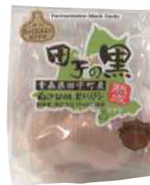
(株)TAKKO商事 田子の黒 (1個入)【17-008】