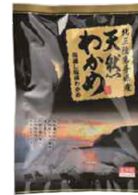
(株)オダカネ 冷蔵 天然わかめ (80g) 308円 【⑨-001】