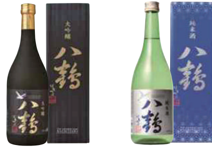
八戸酒類(株) 八鶴「大吟醸」 (720ml) 【28-001】 3,356円