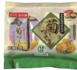
南部特産品振興委員会 菊づくし (2個入×6袋) 【19-001】 800円