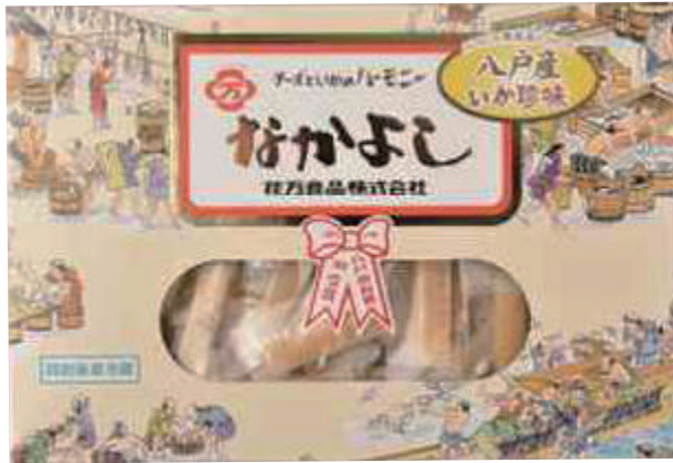
花万食品(株) なかがよし (120g) 【⑧-001】