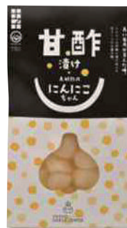
田子町にんにく国際交流協会 にんにく甘酢漬け (100g)【16-009】