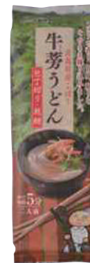
(有)柏崎青果 ごぼううどん (180g) 【⑳-005】 378円