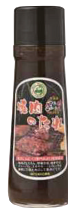
(株)TAKKO商事 黒にんにく 焼肉のたれ (250g)【17-002】