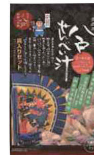
(株)創季屋 八戸せんべい汁 (青森県産鶏具入りセット) (3~4人分)【⑤-003】 1,080円 具材入り