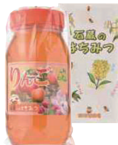
(有)東養蜂場 りんご蜜 (1kg) 【⑳-005】 3,402円