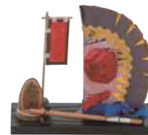
こだまの園 ながえんぶり 烏帽子 (16cm×16.5cm) 【③⑩-008】 3,080円