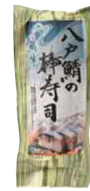
(株)ディメール 八戸鯖の棒寿司 (250g)【⑩-003】 1,008円