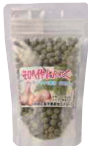
南郷物産協会 モロヘイヤにんにく