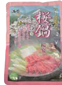
(有)尾形精肉店 桜宴(馬肉鍋の素) (300g) 【19-005】 1,730円