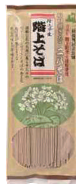
階上町 わっせ交流 センター 階上早生 階上そば (200g) 【⑳-004】 390円