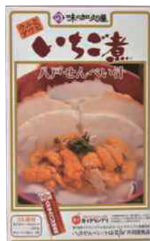
(株)味の加久の屋 いちご煮 八戸せんべい汁 (3人分)【④-003】 1,404円 具材入り