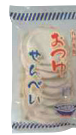
(有)上館せんべい店 おつゆせんべい (10枚)【⑤-010】 238円