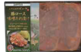
美保野グリーン牧場(株) 冷凍 八戸美保野ポーク 豚ロース味噌たれ漬け (3枚入) 【19-008】 1,080円