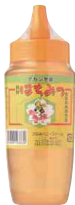
南郷物産協会 アカシヤ蜜 (500g) 【⑳-002】 2,484円