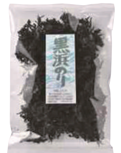
(有)大久保太郎商店 黒浜のり (20g) 【⑨-006】