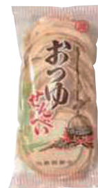
矢野 おつゆせんべい (10枚)【⑤-007】 232円