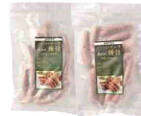
美保野グリーン牧場(株) 冷凍 八戸美保野ポーク腸詰 バジル&オニオン味(320g) 【19-009】 ブラックペッパー味(320g) 【19-010】 各 600円