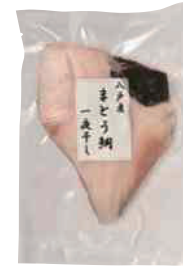
五戸水産(株) 冷凍 八戸産まとう鯛 一夜干し (1枚) 756円 【⑨-012】