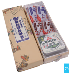
コムラ醸造(株) 冷蔵 なんばんみそ5個セット (120g×4・130g×1) (甘口×2・辛口×2・山椒入×1) 【18-004】 1,200円