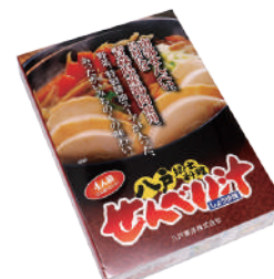
八戸東洋(株) 八戸郷土料理せんべい汁 (しょうゆ味・4人分)【⑤-005】 具材入り