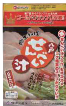
(株)味の加久の屋 八戸せんべい汁 コク塩味 (3人分)【④-002】 1,080円 具材入り

煮立った鍋にせんべいを割り入れ煮込み、お好みの硬さでお召し上がりください。(目安は5分です)