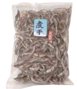
(有)大久保太郎商店 煮干いわし (200g) 【⑨-009】 540円 (350g) 【⑨-010】 864円