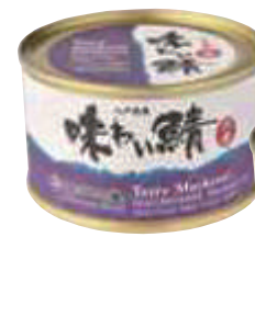
(株)味の加久の屋 味わい鯖(水煮) (200g)【⑩-010】