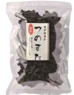
(株)オダカネ つのもた (30g) 540円 【⑨-003】