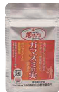
(株)小野寺醸造元 ガマズミの実サプリ (50粒) 【⑳-002】 1,296円