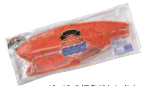
(株)ヤマヨ 冷凍 定塩紅鮭 (甘口) (1枚) 【⑧-009】