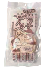
(株)味の海翁堂 南部庵 鍋っ子せんべい (8枚)【⑤-008】 216円