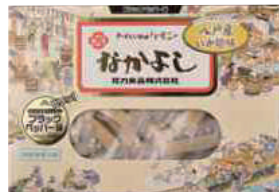
花万食品(株) なかがよし (ブラックペッパー) (120g) 【⑧-003】