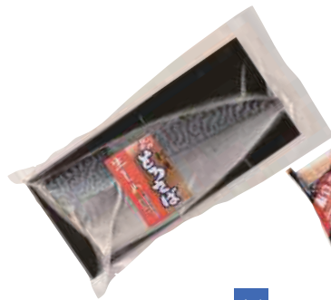
(同)マルカネ 刺身とろさば生しめ (1枚)【⑩-001】 756円