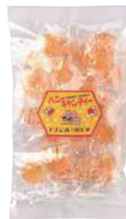
山内養蜂園 ハニーキャンディー (100g) 【⑳-010】 473円