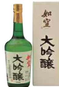
八戸酒類(株) 如空「大吟醸」 (720ml) 【28-003】 3,357円