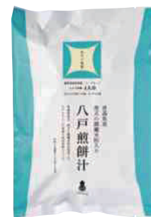
(株)創季屋 青天の霹靂 米粉入り 八戸煎餅汁 (4人分)【⑤-002】 700円 具材なし