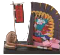
こだまの園 どうさい えんぶり烏帽子 (16cm×16.5cm) 【③⑩-007】 2,750円