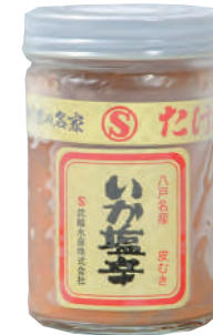
武輪水産(株) 冷凍 いか塩辛(極上・皮むき) (180g) 【⑦-003】 1,188円