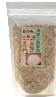
山部商店 健康七穀家族 (250g) 【⑳-009】 495円