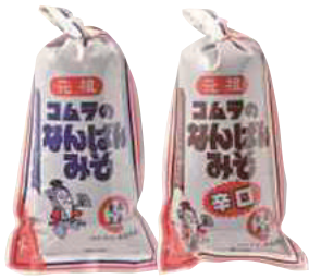
コムラ醸造(株) 冷蔵 なんばんみそ(甘口) (230g) 【18-001】 362円 なんばんみそ(辛口) (230g) 【18-002】 362円