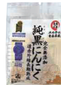
(株)岡崎屋 純黒にんにく (1個入)【17-010】