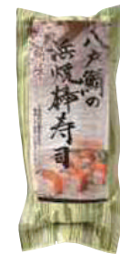
八戸鯖の浜焼棒寿司 (250g)【⑩-004】 1,008円