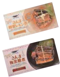
武輪水産(株) さんま蜂蜜レモン煮 (4切入) 【⑧-007】 さんま梅黒糖煮 (4切入) 【⑧-008】