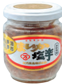
花万食品(株) 冷蔵 まいか塩辛(特上) (160g) 【⑦-001】 810円