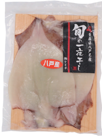
(株)ヤイチ 冷凍 いか一夜干し (2枚) 【⑥-001】 970円