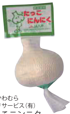
田子かわむら アグリサービス(有) たっこニンニク (1個)【16-001】