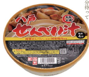
八戸東洋(株) 八戸郷土料理 カップせんべい汁 (しょうゆ味・1人分)【④-004】 540円 具材入り

郷土料理の「ごいちご煮」と 「せんべい汁がまきかのコラボ」 高級感あふれる一品をどうぞ。