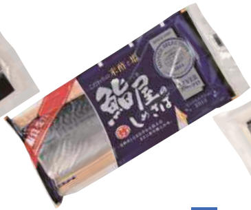
(株)ディメール 鮭屋のしめさば (1枚)【⑩-002】 432円