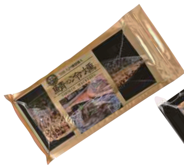
(株)ディメール 鯖の冷薫 (1枚)【⑩-007】 597円