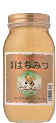
南郷物産協会 アカシヤ蜜 (1kg) 【⑳-001】 4,752円