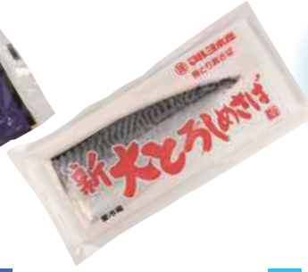
マルヨ水産(株) 新大とろしめさば (1枚)【⑩-003】 414円