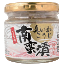
五戸水産(株) 冷凍 真いかこうじ南蛮漬 (100g) 【⑦-009】 432円