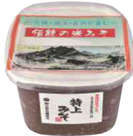
(株)小野寺醸造元 特上みそ(米みそ) (1kg) 【18-006】 540円