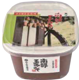
(株)小野寺醸造元 南部玉みそ (1kg) 【18-005】 540円