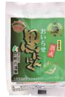
(有)柏崎青果 おいらせ熟成 黒にんにく (1個入)【17-007】