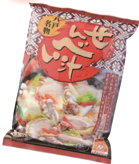
せんべい汁生産協会の 八戸名物「せんべい汁」 (4人分)【④-001】 648円 具材なし

お好みの具材を入れて煮込むだけで 出来上がり。 コクのあるスープが大変美味しいと 評判です。