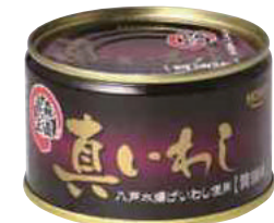
(株)宝幸八戸工場 真いわし醤油味缶詰 (200g)【⑩-012】