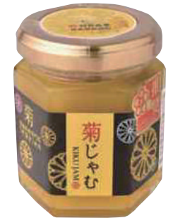
(有)村井青果 菊じゃむ (120g) 【19-004】 680円