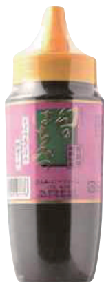
南郷物産協会 幻のはちみつ (そば) (500g) 【⑳-003】 2,484円