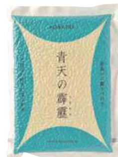
(株)ライケット 青天の霹靂 (300g・2合分) 【⑳-007】 432円