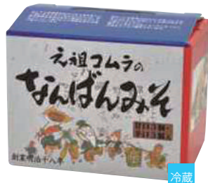
コムラ醸造(株) 冷蔵 なんばんみそ(化粧箱) (120g×6)(甘口×3・辛口×3) 【18-003】 1,337円