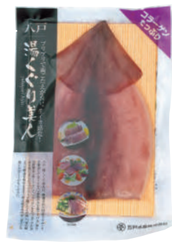
五戸水産(株) 冷凍 湯ぐり美人 (1枚) 【⑥-004】 620円