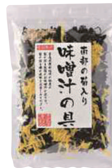
(株)オダカネ 菊入り味噌汁の具 (65g) 【⑨-007】 550円