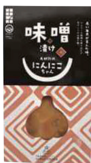
田子町にんにく国際交流協会 にんにく味噌漬け (100g)【16-008】