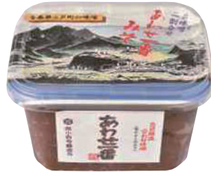
(株)小野寺醸造元 あわせ一番 (500g) 【18-007】 324円