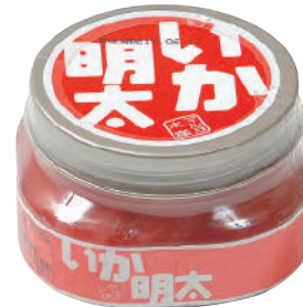
マルヨ水産(株) 冷蔵 いか明太 (150g) 【⑦-006】 623円