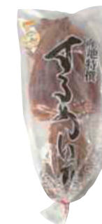
五戸水産(株) 冷凍 干しするめ (3枚) 【⑦-005】 1,380円