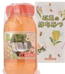
(有)東養蜂場 とち蜜 (1kg) 【⑳-006】 3,402円