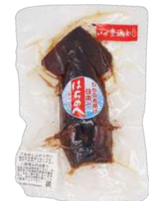
(株)マルチン 冷凍 いか豊漁めし (1本入) 【⑧-006】 1,260円