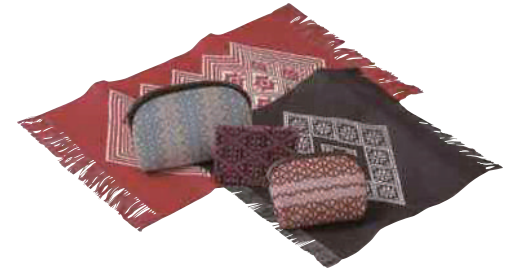
西野刺っ娘の会 南部菱刺し