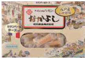
花万食品(株) なかがよし (カマンベール) (120g) 【⑧-002】