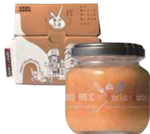
田子町にんにく国際交流協会 TAKKO Garlic jam (120g)【16-004】