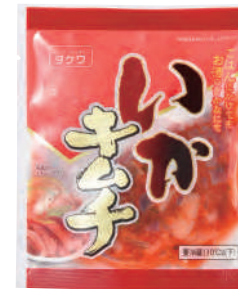
武輪水産(株) 冷凍 いかキムチ (80g) 【⑦-007】 180円