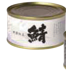
(株)GMK(金剛グループ) 鯖水煮缶(厳選) (180g)【⑩-008】 800円