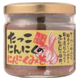
田子町にんにく国際交流協会 たっこにんにくのんにくみそ (150g)【16-002】