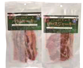
美保野グリーン牧場(株) 八戸美保野ポークジャーキー パラ(43g) 【19-011】 ロース(41g) 【19-012】 各 600円