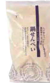
(同)たちばな 鍋せんべい (10枚)【⑤-009】 230円