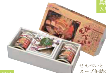
(株)味の加久の屋 せんべい汁セット (2~4人分)【⑤-006】 具材入り