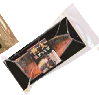
(同)マルカネ 黄金焼とろさば (1枚)【⑩-008】 756円