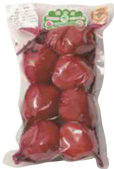
南郷物産協会 南部八助梅漬 冷蔵 (500g) 【18-008】 720円