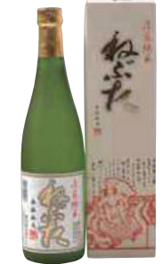
桃川(株) ねぶた「淡麗純米」 (720ml) 【29-004】 1,122円