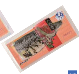
武輪水産(株) たたきしめさば (1枚)【⑩-006】 520円