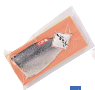
(株)ヤイチ しめさば (1枚)【⑩-004】 460円