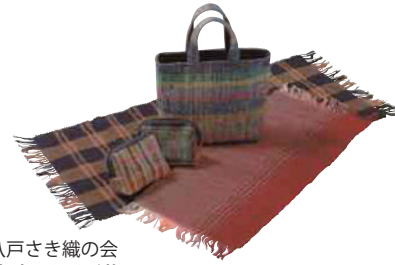
八戸さき織の会 南部さき織り 卓布 (1枚) 【③⑩-001】

いがずきんズぬいぐるみ (大約25cm・1個) 【③⑩-009】 各2,750円