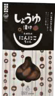
田子町にんにく国際交流協会 にんにくしょうゆ漬け (100g)【16-007】