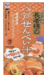
(株)味の海翁堂 長者様の八戸せんべい汁 (青森県産シャモロック使用) (3人分)【⑤-004】 具材入り