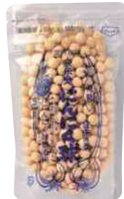
にんにく球製造所 にんにく球