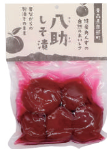
(株)アグリーデザイン 八助のしそ漬 (240g) 【18-009】 724円