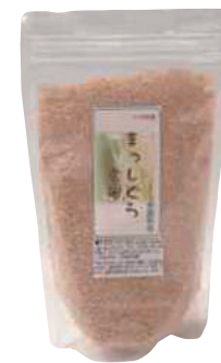
山部商店 まっしぐら玄米 (500g) 【⑳-008】 260円