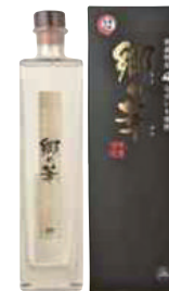
(株)泉農場 ながいも焼酎 「郷の華」原酒(38°) (500ml) 【29-009】 6,050円