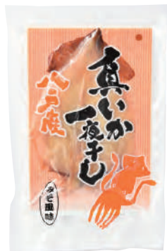
五戸水産(株) 冷凍 真いか一夜干し (みそ風味) (1枚) 【⑥-003】 770円