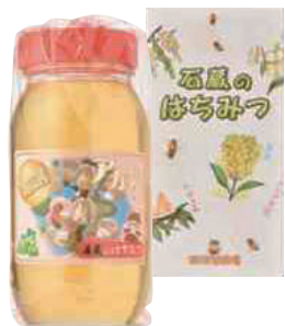
(有)東養蜂場 アカシヤ蜜 (1kg) 【⑳-004】 4,633円