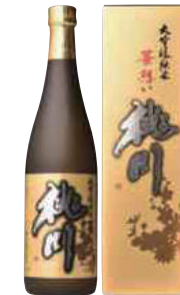
桃川(株) 桃川「大吟醸華想い」 (720ml) 【29-002】 2,200円