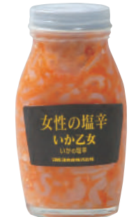
マルヨ水産(株) 冷蔵 いか乙女 (180g) 【⑦-005】 545円