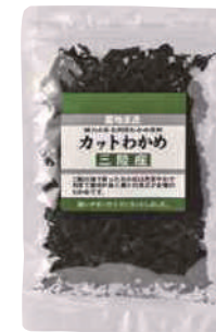
(株)オダカネ カットわかめ (30g) 540円 【⑨-002】