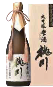
桃川(株) 桃川「大吟醸雫酒」 (720ml) 【29-001】 5,500円