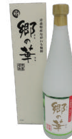
(株)泉農場 ながいも焼酎 「郷の華」 (720ml) 【29-010】 2,420円