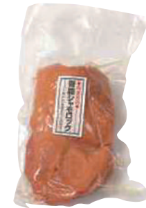
(株)グローバルフィールド 青森シャモロック燻製(もも肉) (1枚) 【19-006】 1,560円