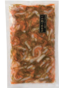
(株)ヤマヨ 冷凍 いか刺し松前漬 (300g) 【⑦-008】 800円