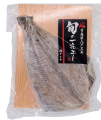
(株)ヤイチ 冷凍 しまほっけ 一夜干し (1枚) 【⑧-011】