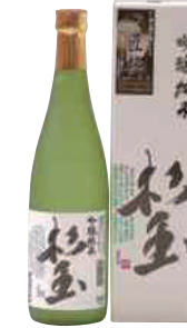
桃川(株) 杉玉「吟醸純米」 (720ml) 【29-003】 1,650円