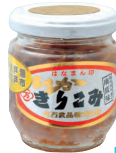
花万食品(株) 冷蔵 いかきりこみ(南蛮味) (160g) 【⑦-002】 810円