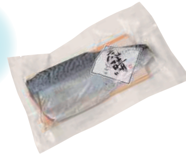
(株)ホテル八甲 虎鯖(メ鯖刺し) (1枚)【⑩-001】 1,296円

八戸前沖は、日本のサバの漁場としては本州最北端に位置しています。中でも「八戸前沖さば」は、八戸前沖さばブランド推進協議会が認定した期間に八戸前沖で漁獲し、八戸港に水揚げされたサバのことを言います。脂肪分はおおむね15%以上を目安とし、大型の銀鯖は30%以上の大トロにも匹敵する脂肪分の鯖もあります。八戸の「しめさば」や「鯖缶」は絶品です。