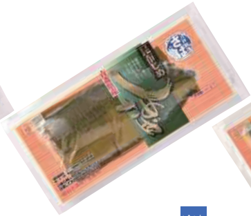
武輪水産(株) 昆布じめしめさば (1枚)【⑩-005】 520円