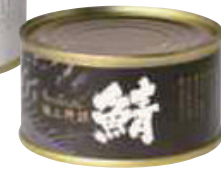
鯖水煮缶(極上) (180g)【⑩-009】 950円