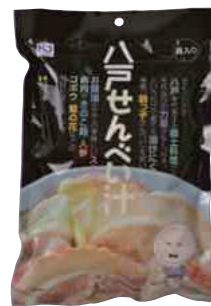
(株)味の海翁堂 八戸せんべい汁 (2人分)【⑤-001】 648円 具材入り