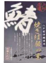
(株)ヤイチ 鯖さば飯の素 (2合×2回分)【⑩-007】 700円