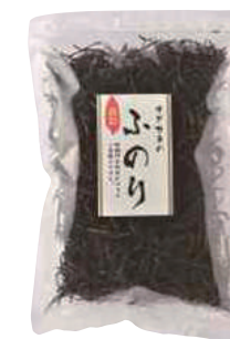
(株)オダカネ ふのり (30g) 【⑨-005】