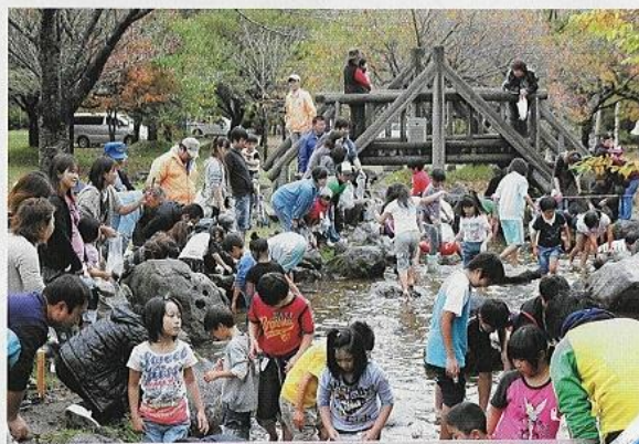
新郷村ふるさとまつり『川魚つかみどり大会』

大駒ヶ岳・戸来岳・大文字山からなる三ッ嶽。大駒ヶ岳(標高1,144m)に自生するダケカンバは、日本一と称され多くの登山客が訪れます。