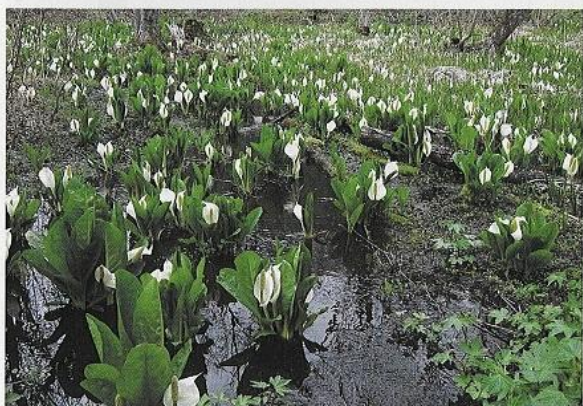
村の花『みずばしょう』

新郷村は、青森県のほぼ南端で十和田湖の東にあります。また、十和田湖と八戸を結ぶ国道454号が村を横断し、観光の架け橋となっています。