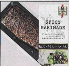
第2位 鯖スパイシーマリネ 武輪水産(株)