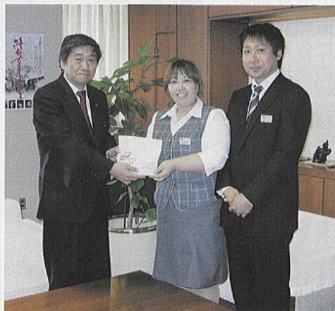
小林真八戸市長(左)

皆様のご理解・ご協力に重ねて御礼申し上げます。僅かではございますが、被災者のお役に立てればと願っております。