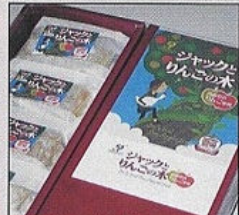
第1位 ジャックとりんごの木 (有)ピエロ

受賞した商品は、コンテスト後の売上も好調で、来年度は、第2回の開催も予定しております。