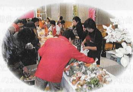
新鮮野菜を求めて…