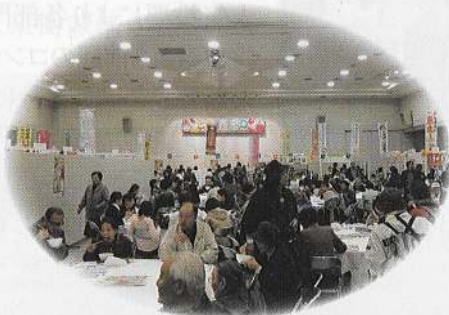
飲食ブースは大盛況!