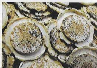
さんのへせんべい