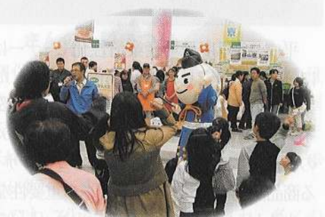
じゃんけん大会の様子