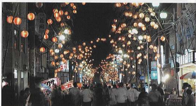
さんのへ夏まつり

8月中旬に開催されるさんのへ夏まつりは、町の目抜き通りに大きな竹が数十本立ち、それに約3千個のちょうちんが取り付けられることから「ちょうちんまつり」とも呼ばれます。火がともると歩行者天国を歩く人々を幻想的に照らします。