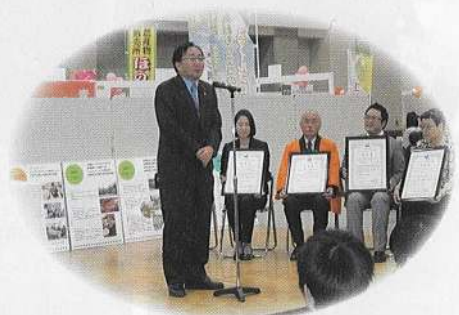
コミュニティビジネス見本市表彰式

平成25年10月26日(土)・27日(日)の両日に、今年度で6回目の開催となり地域の皆様からご好評いただいております、「大集合!ユートリー産直・郷土食フェア2013」を開催いたしました。