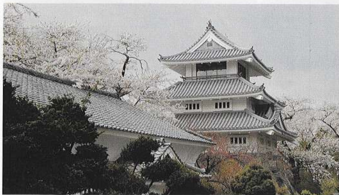
三戸城跡「県立城山公園」

気候は寒暖の差が激しく、夏は35度近くまで上がり、冬はマイナス10度近くまで下がります。この気温の差を利用したリンゴ、ブドウ、モモといった果樹栽培が盛んです。