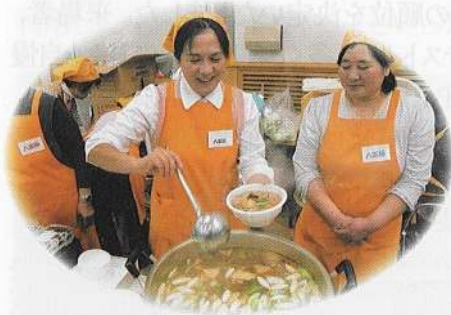
せんべい汁の販売