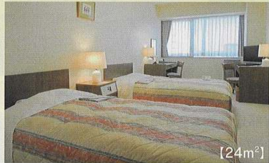
【24m 2 】