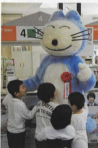
11ぴきのねこのまち

現在は県立城山公園として、春は1,600本の桜が咲き誇る、県南随一の桜の名所として親しまれているほか、四季を通じて皆さんに親しまれる公園となっています。