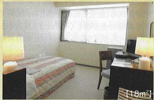
【18m 2 】